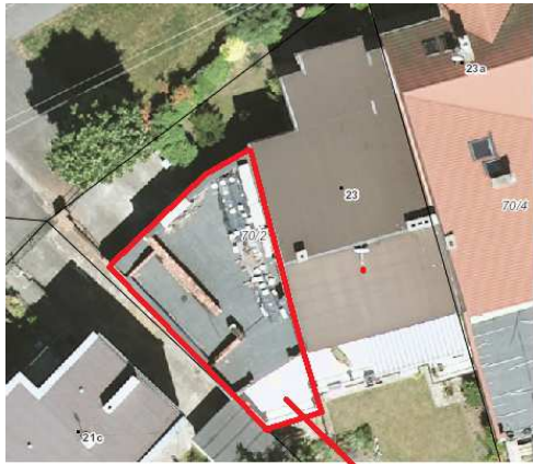
obiekt objęty nakazem rozbioru